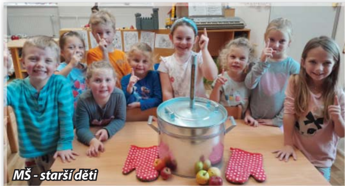
MŠ - starší děti