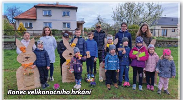
Konec velikonočního hrkání