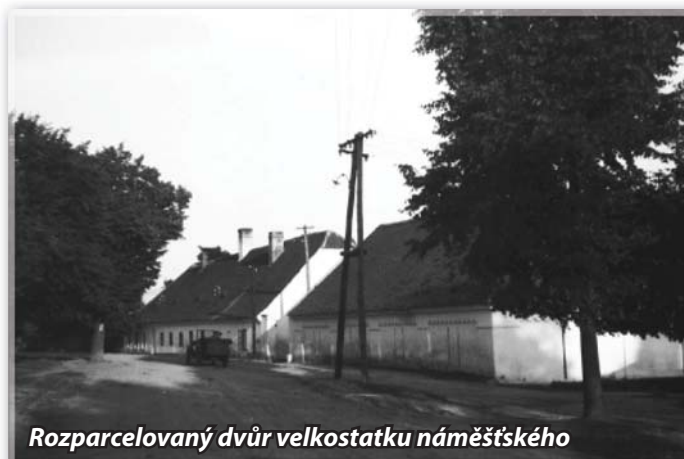
Rozparcelovaný dvůr velkostatku náměšťského