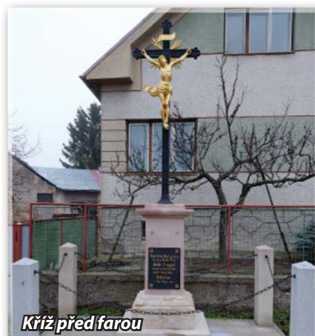
Kříž před farou

Po obdržení povolení od konzistoře ze dne 8. června 1855, č. j. 1363, byl kříž církevně posvěcen o sedmé neděli po sv. Duchu dne 14. července 1855 s podmínkou, že udržování kříže nebude záležitostí kostela, ale že udržování kříže bude starostí farníků.“ Dále se v kronice píše: „Na památku jubilejního roku 1901 byl obnoven železný kříž, který stával před vchodem na hřbitov, kde po pořízení nové železné brány neměl místa. Byl přeložen na prostranství před farou, kde je pravou okrasou místa, konají se u něho počáteční pohřební obřady a zastavení o Křížových dnech před svátkem Nanebevstoupení Páně.“