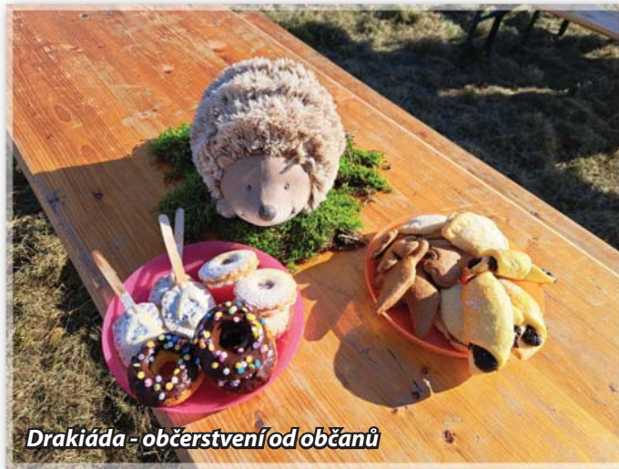
Drakiáda - občerstvení od občanů