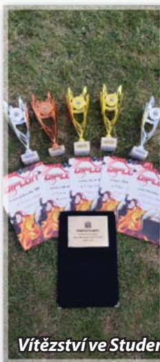
Vítězství ve Studenci