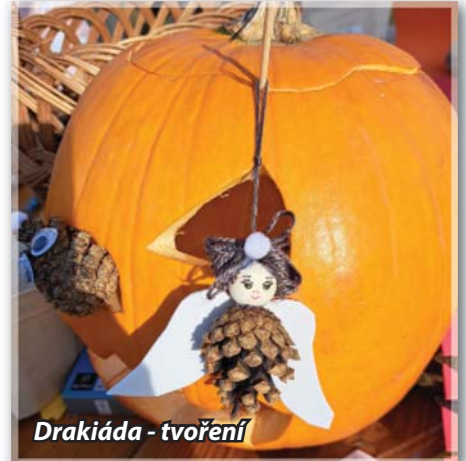
Drakiáda - tvoření