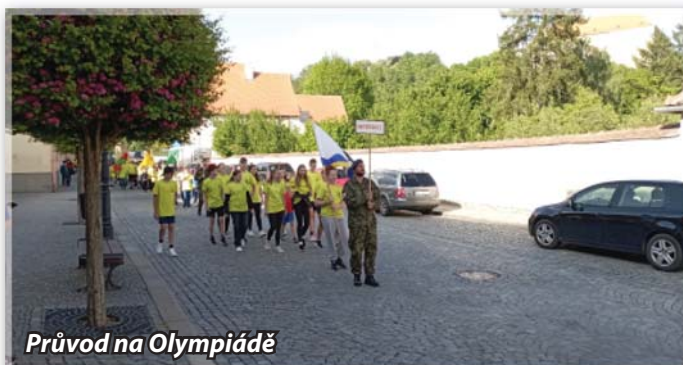
Průvod na Olympiádě