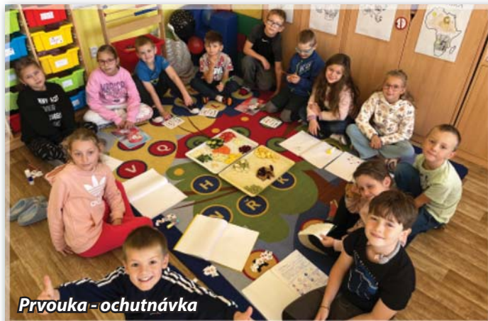
Prvouka - ochutnávka