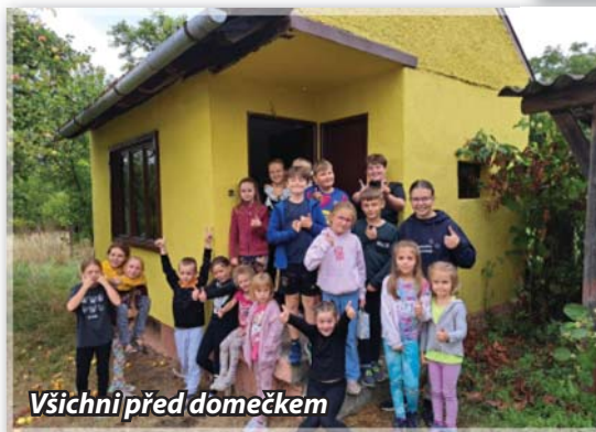
Všichni před domečkem