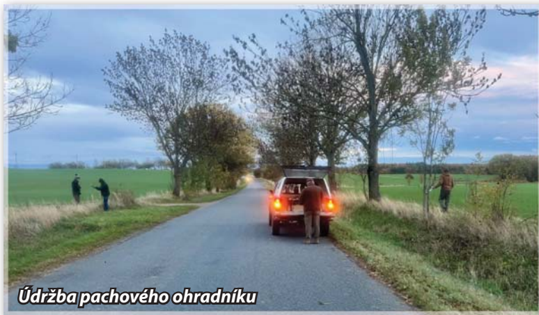
Údržba pachového ohradníku