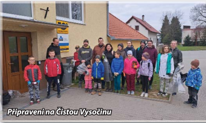
Připraveni na Čistou Vysočinu