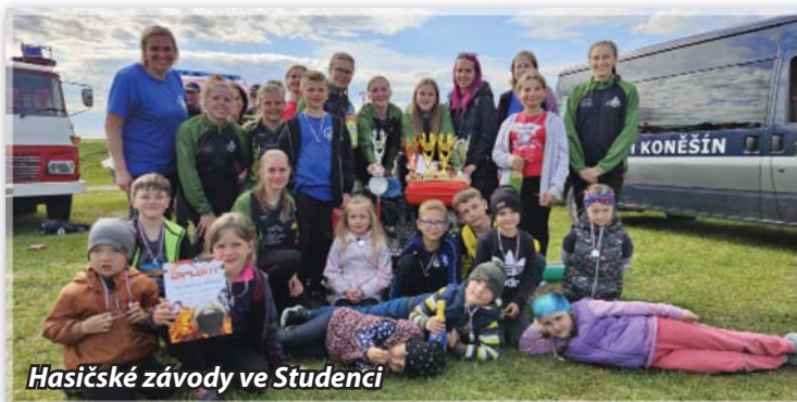
Hasičské závody ve Studenci