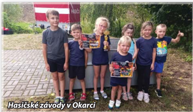
Hasičské závody v Okarcí