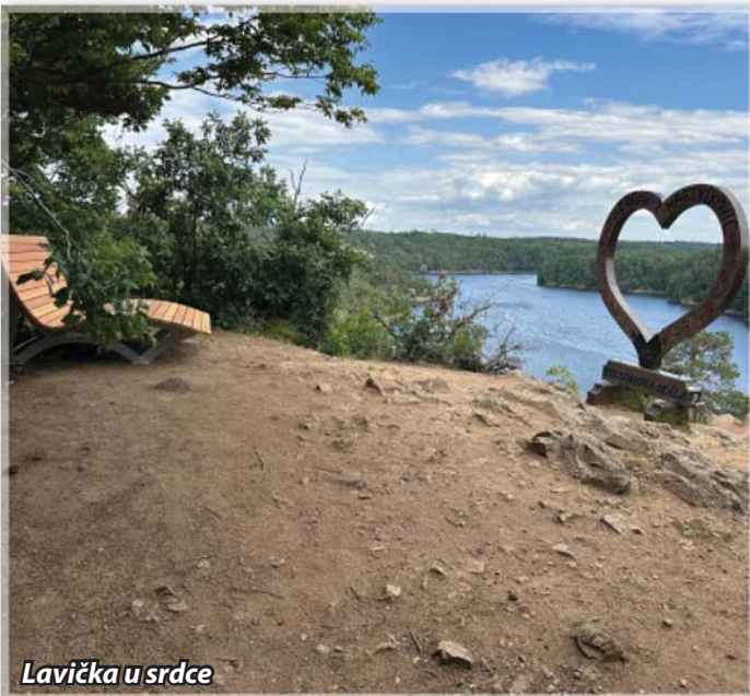
Lavička u srdce