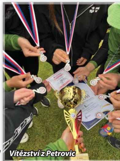
Vítězství z Petrovic