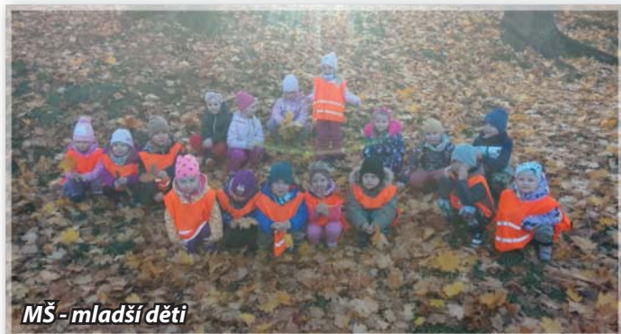
MŠ - mladší děti