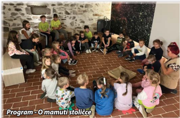
Program - Omamutí stoličky

Zaměstnanci, žáci a děti ZŠ a MŠ Hartvíkovic, p. o.