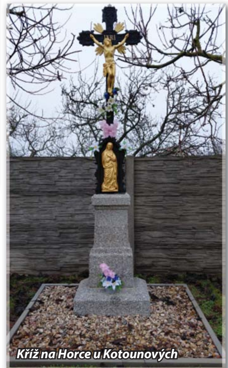
Kříž na Horce u Kotounových

O tomto kříži se nepodařilo získat žád- né bližší informace. Mohlo by se jednat o tzv. „Trandův kříž“ posvěcený v roce 1893 (Trandovi obývali dům č. p. 9), nicméně to nelze napsat s jistotou. Kdo z vás by o tom- to kříži měl informace, dejte, prosím, vědět na obecní úřad nebo přímo mně.