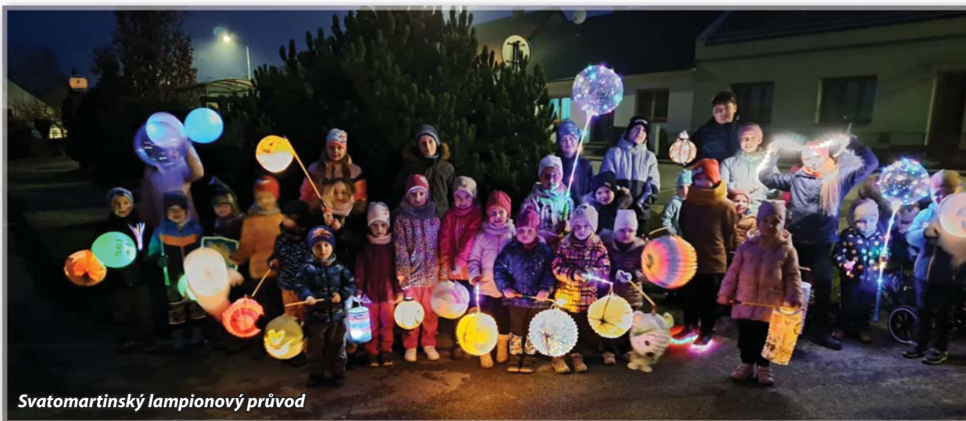
Svatomartinský lampionový průvod