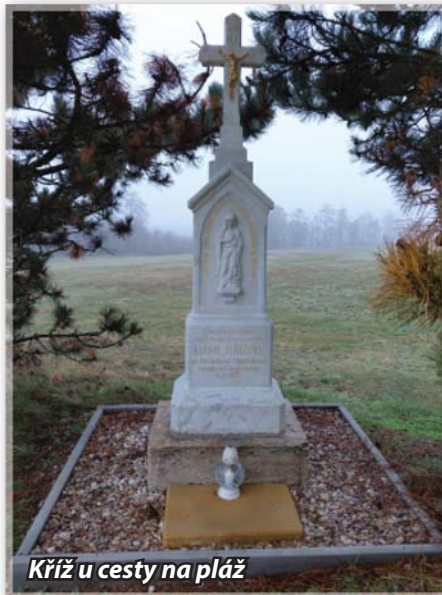
Kříž u cesty na pláž