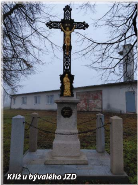
Kříž u bývalého JZD