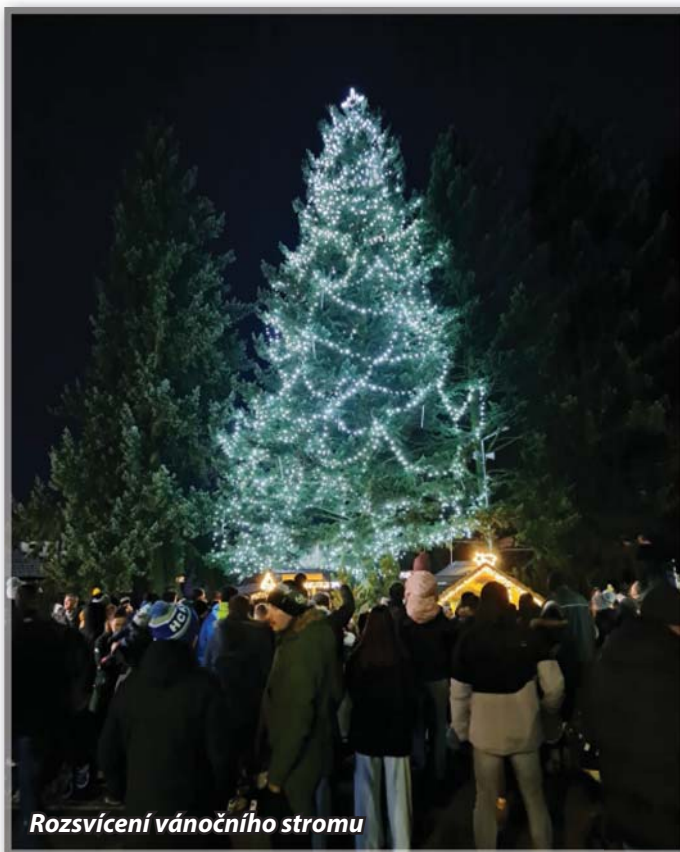
Rozsvícení vánočního stromu