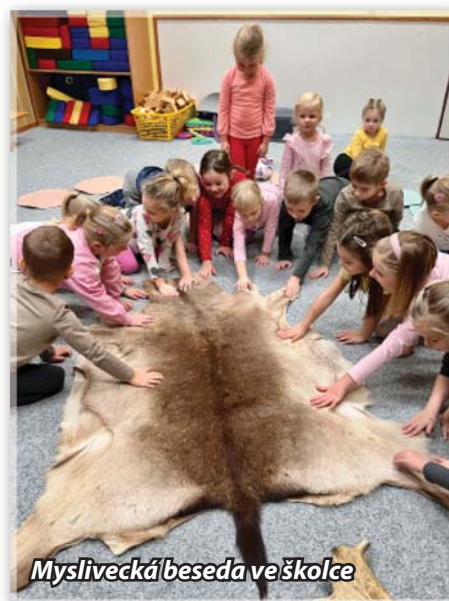
Myslivecká beseda ve školce