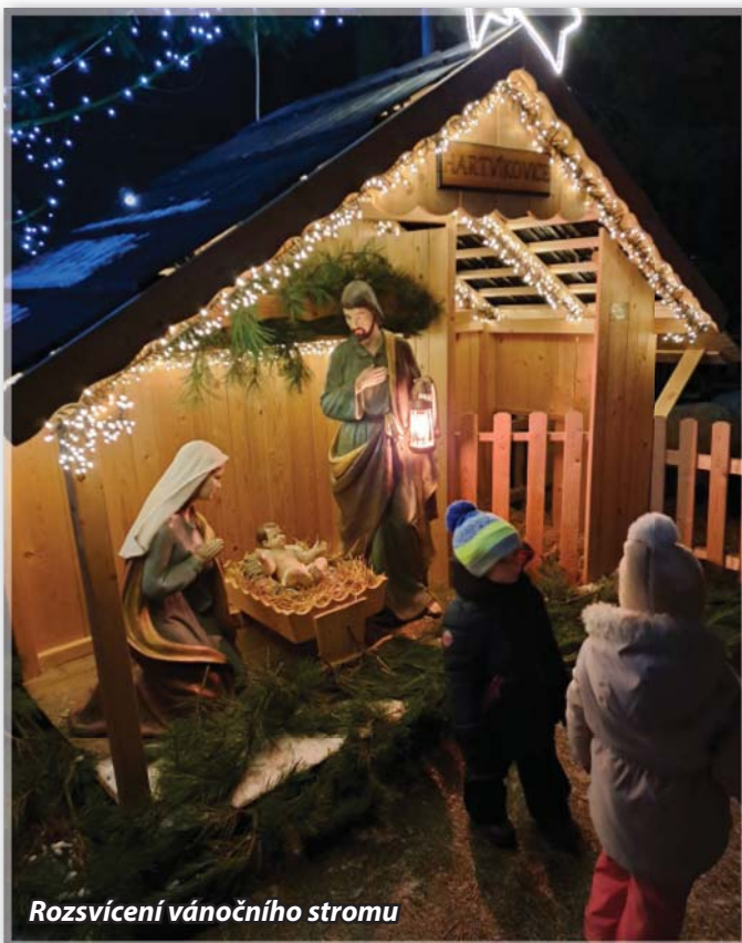
Rozsvícení vánočního stromu