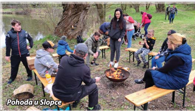
Pohoda u Slopce