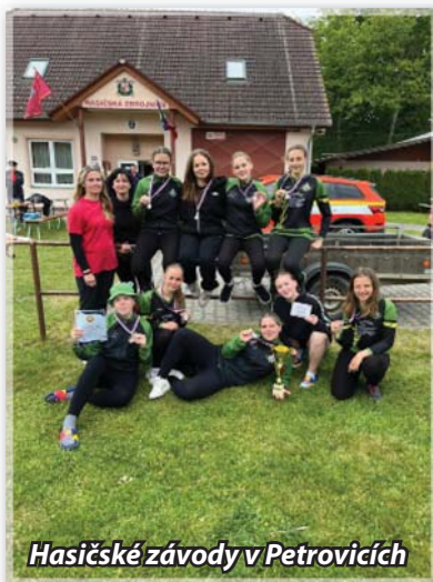
Hasičské závody v Petrovích