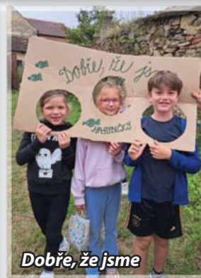
Dobře, že jsme