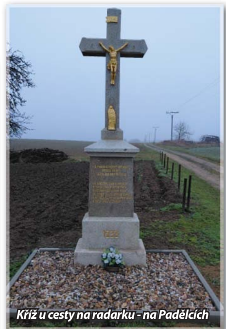
Kříž u cesty na radarku - na Padělcích

Ve stejném roce byla v obci dokon- čena a posvěcena kaple Československé církve husitské, do níž vstoupila řada místních obyvatel, kteří dříve patřili ke katolické církvi. V tomto kontextu je třeba číst i nápis na tomto kříži: „Já křesťan jsem a katolík a svatá církev je má máti, a vzdávám Bohu čest a dík, že synem jejím smím se zváti, k ní před celým se světem znám a svoji víru vyznávám.“