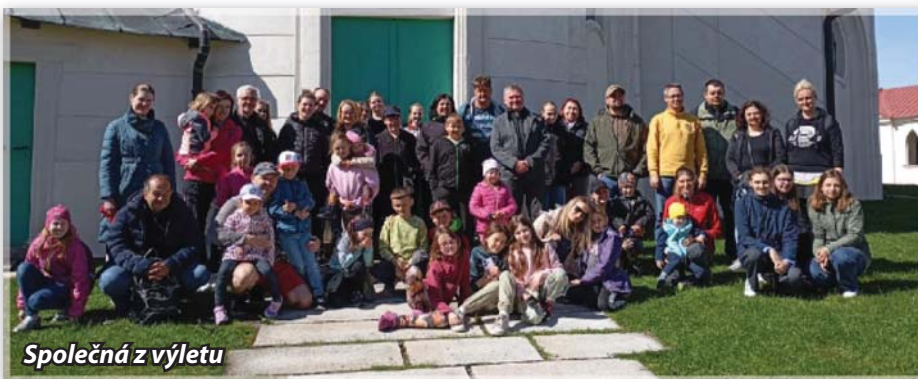
Společná z výletu